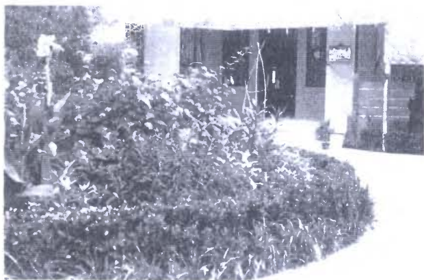
Hapro Office 1937 in Nanking